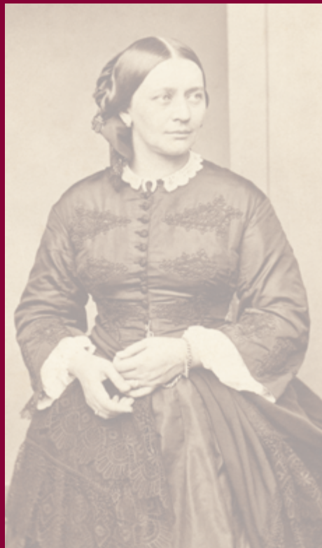
200 Jahre Clara Schumann